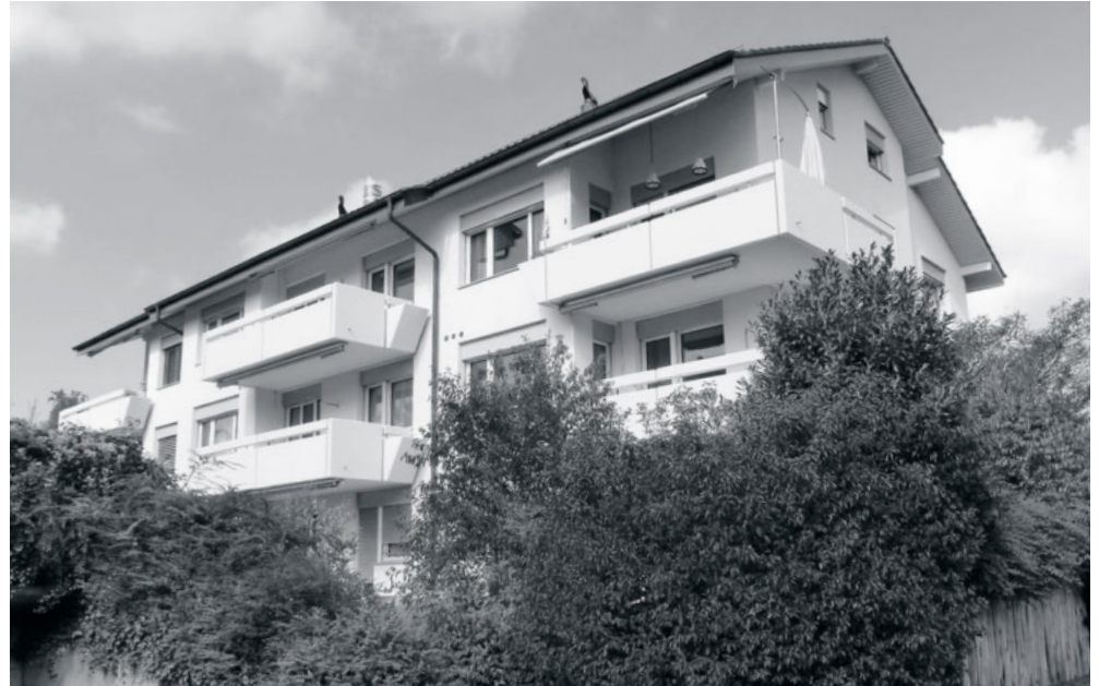
Sanierungsprojekt in Rudolfstetten AG, Hofackerstrasse 44–48